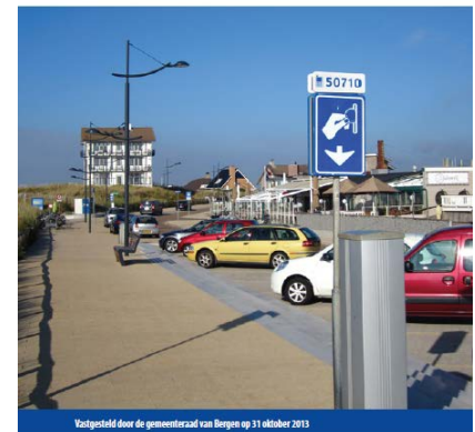
Gemeente Bergen Gastvrij Parkeerbeleid