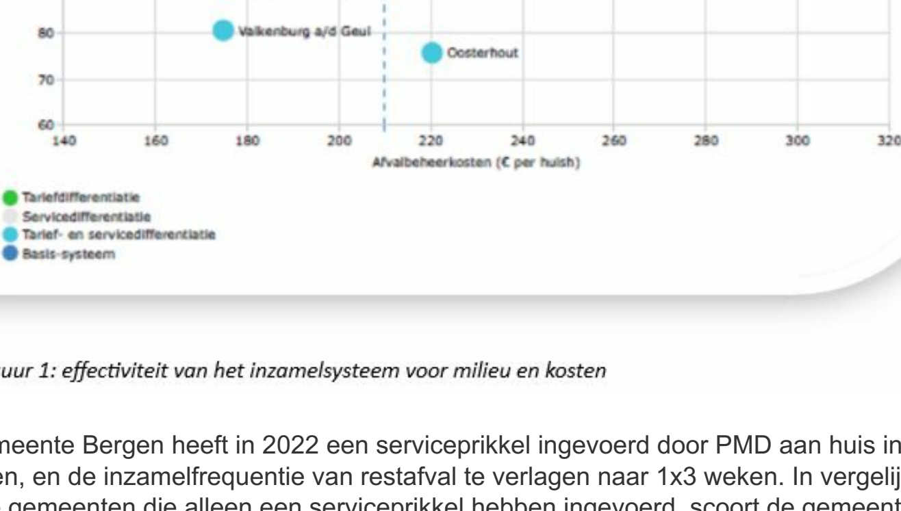
Figuur 1: effectiviteit van het inzamelsysteem voor milieu en kosten

In het kaartje hieronder is goed te zien dat de best presterende gemeenten allemaal een combinatie van een serviceprikkel (restafval minder vaak inzamelen of restafval wegbrengen naar een ondergrondse verzamelcontainer) en een tariefprikkel hebben ingevoerd. Deze combinatie is de meest geschikte manier om niet alleen de milieuresultaten te verbeteren maar om daarnaast de kosten te verlagen.