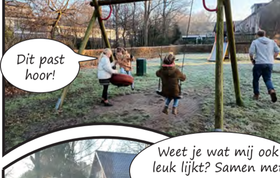
Bij de Goudert (004) is het ook leuk spelen in het gras. De schommel is leuk want die heb je nergens anders.

Dit is een erg leuke speelplek met heuveltjes en een bruggetje!