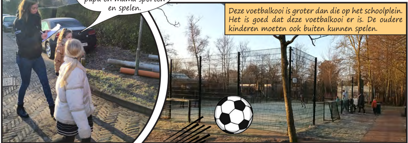
Deze voetbalkooi is groter dan die op het schoolplein. Het is goed dat deze voetbalkooi er is. De oudere kinderen moeten ook buiten kunnen spelen.

Al en met al zijn er best wel een paar leuke speelplekken te vinden in deze wijk. Verderop in de wijk zijn nog een aantal speelplekken waar de kinderen ook graag komen maar ze mogen niet zomaar de Landweg oversteken. Het Kabouterpad wordt genoemd, het zogeheten klimbos en je kunt ook spelen bij de Beek. De Mytylschool in Bergen is bekend bij de kinderen. Ze weten dat kinderen met een beperking daar kunnen spelen. Volgens de onderwijzeres is deze locatie tijdelijk maar de kinderen die daar zitten komen niet uit Bergen. Tot zover de ontdekkingen tijdens deze kinderwandeling. Tot speels!