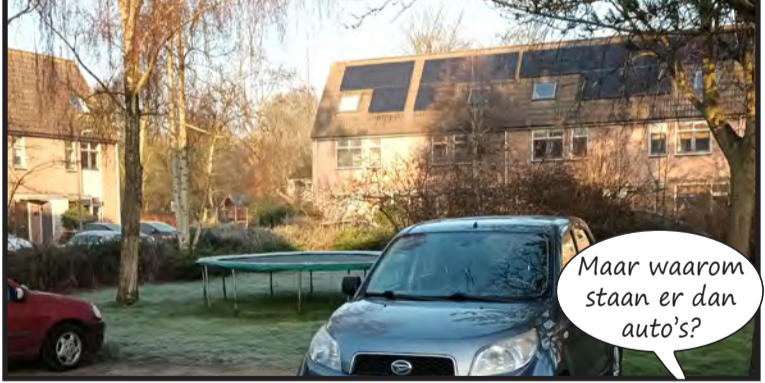
Op het pleintje van de Goudert hebben bewoners zelf een trampoline neergezet.