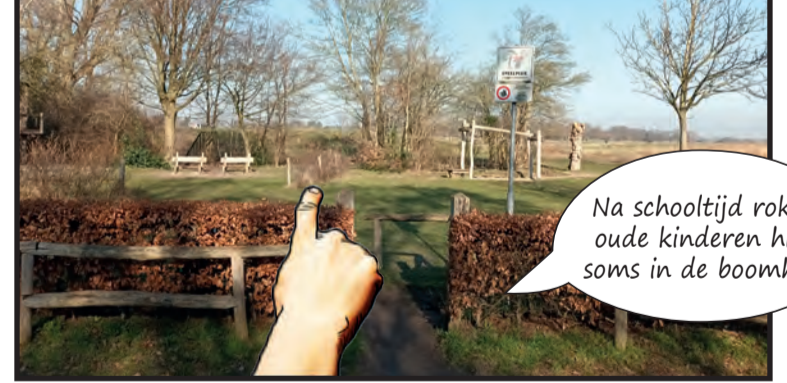
Bij Zakedijkje (013) spelen de kinderen met school en ook na school komen ze er graag.

Na schooltijd roken oude kinderen hier soms in de boomhut.