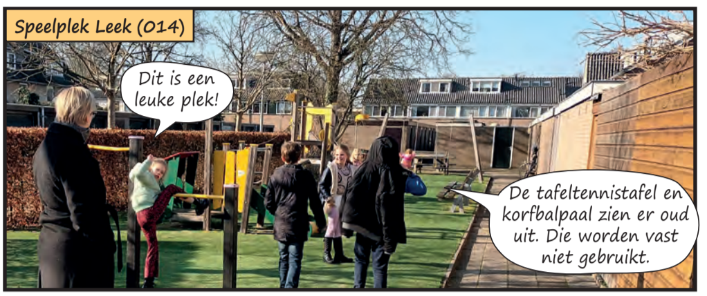
Speelplek Leek (014)

De eerste steeg dichtbij school gaan we in