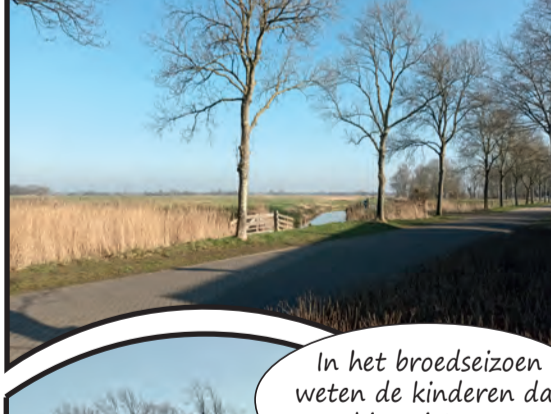
Wat een mooi uitzicht langs het Zakedijkje.

In het broedseizoen weten de kinderen dat ze hier niet mogen "storen".