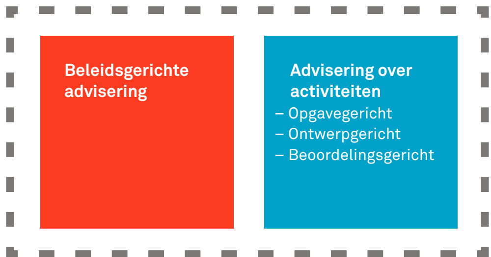
Figuur 5 Samenhang is de essentie van het adviesstelsel

Dit vergt keuzes met betrekking tot de context en de reikwijdte van de advisering, en de samenhang tussen verschillende adviesrollen. Deze keuzes hangen samen met de aard van de omgevingsvisie en het omgevingsplan. De gemeenteraad moet besluiten hoe het adviesstelsel, de som der delen, vorm krijgt. Samenhang is de essentie van een ‘eenvoudig beter’ lokaal adviesstelsel.