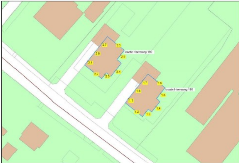
Figuur 2. Waarneempunten