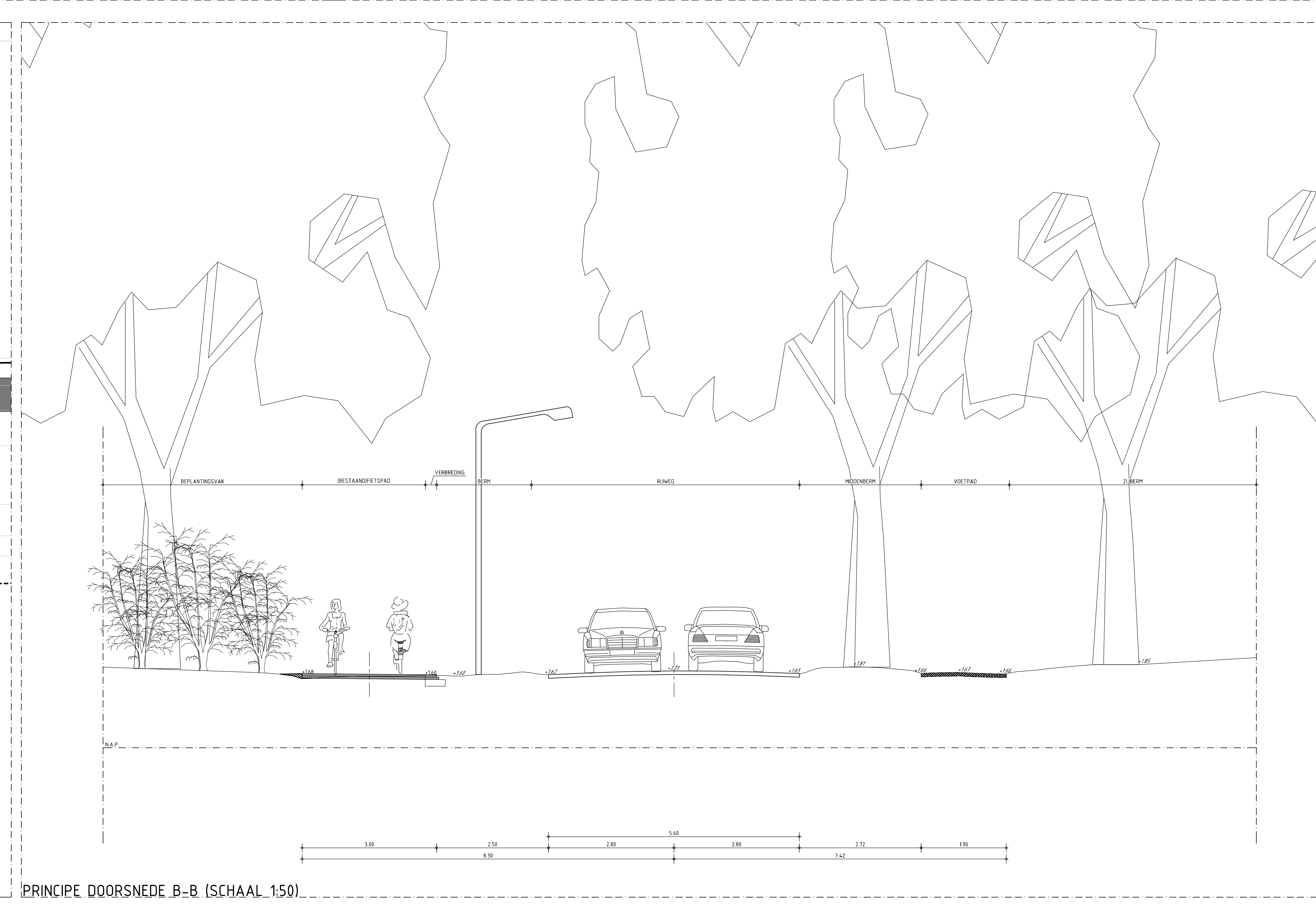
PRINCIPE DOORSNEDE B-B (SCHAAL 1:50)