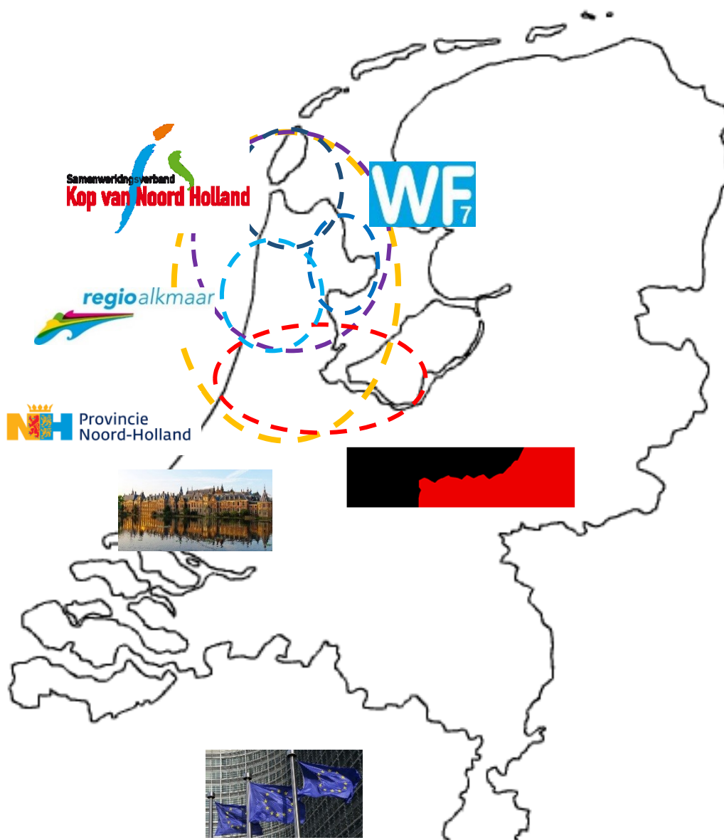
Figuur: Diverse overheidssamenwerkingsverbanden van de BUCH