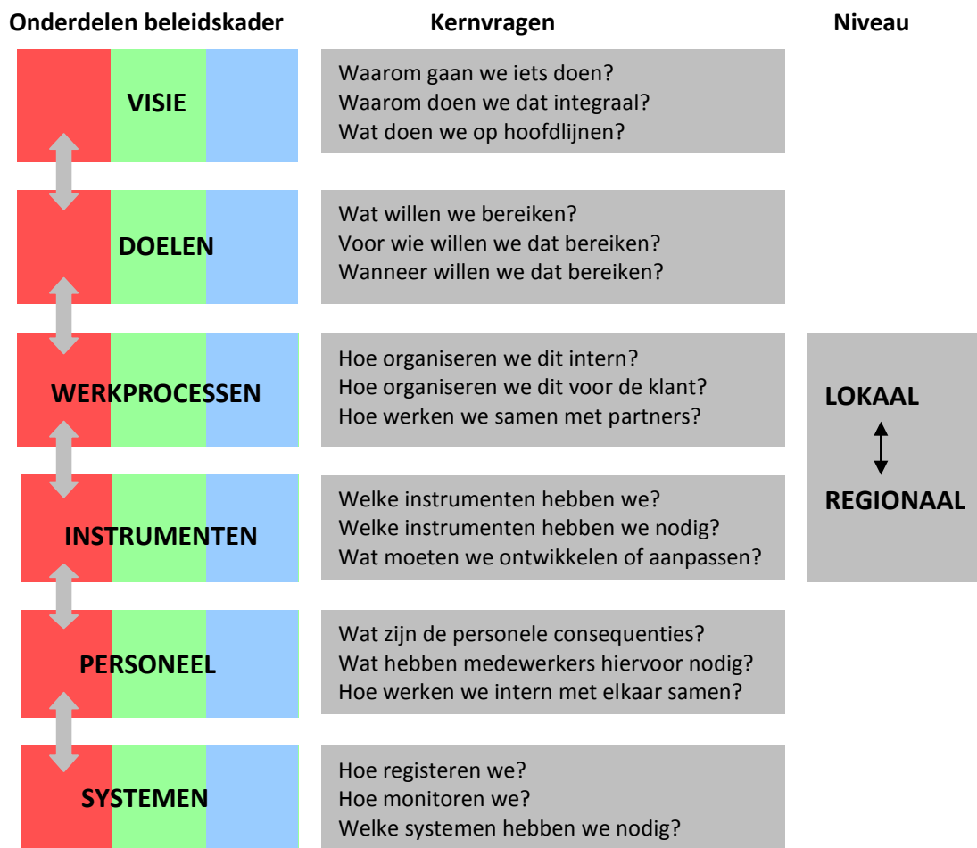
Figuur 3 Stappenplan integraal beleidskader

Bij het ontwikkelen van het integraal beleidskader 3D moeten we zorgen voor horizontale afstemming tussen de verschillende onderdelen van het beleidskader (de tweezijdige pijlen). Instrumenten moeten bijvoorbeeld nauw aansluiten op de doelstellingen die worden nagestreefd. Daarnaast moeten we zorgen voor verticale afstemming tussen de drie decentralisaties (de drie verschillend gekleurde blokken) en is het de uitdaging te komen tot een integrale benadering. Tenslotte maken we hierbij voortdurend de afweging wat lokaal kan/moet en wat regionaal kan/moet.