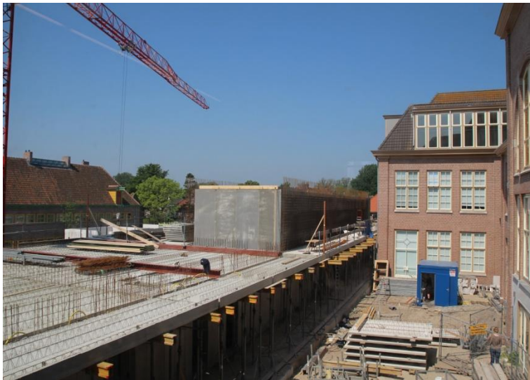
Het nieuwe depotgebouw, halverwege en eind 2012

De archieven bevonden zich in 2012 nog in het oude depot aan de Hertog Aalbrechtweg. Het transport van de stukken tussen de twee locaties is zonder problemen verlopen.