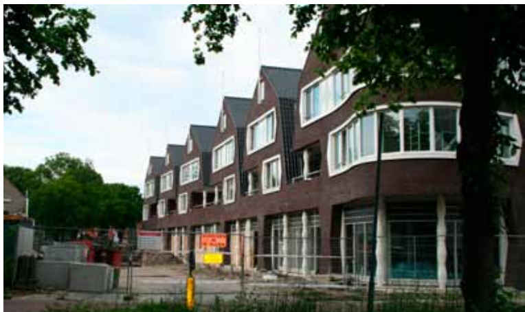
Juni 2013: de laatste hand wordt gelegd aan winkels en woningen in project 'Hartje Bergen'. Hiermee is de eerste stap in de herontwikkeling van het centrum van Bergen bijna een feit.